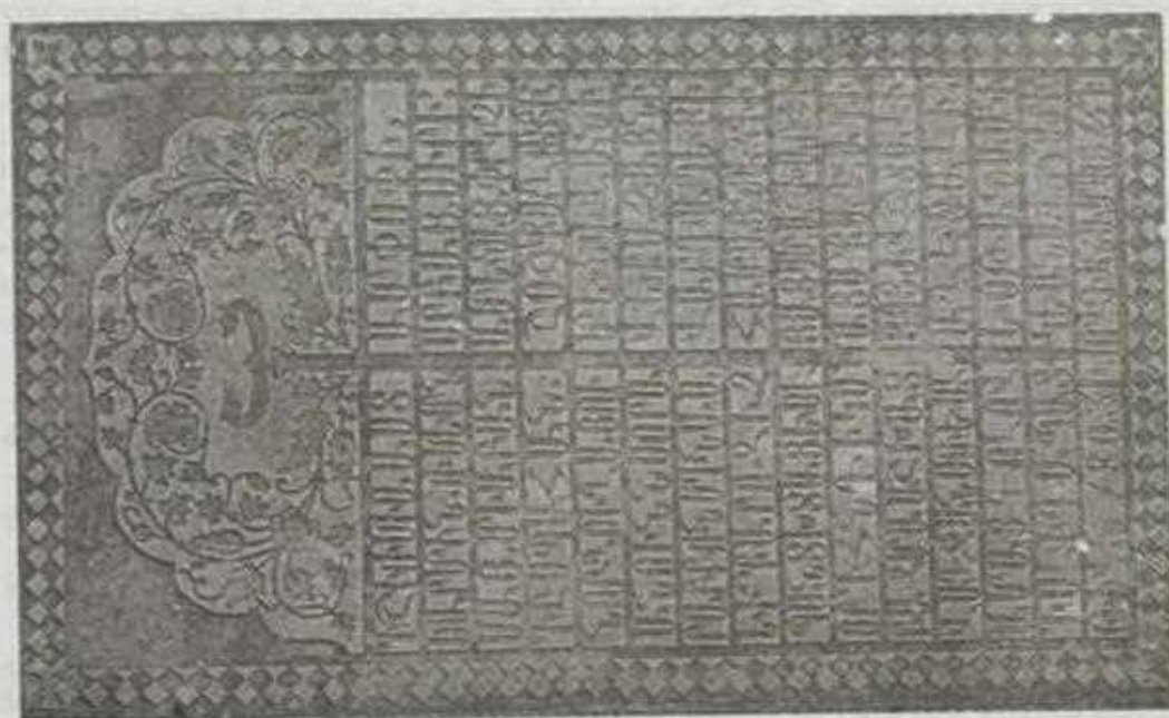
Էջմիածնի Նուիրակի տապանաքարը