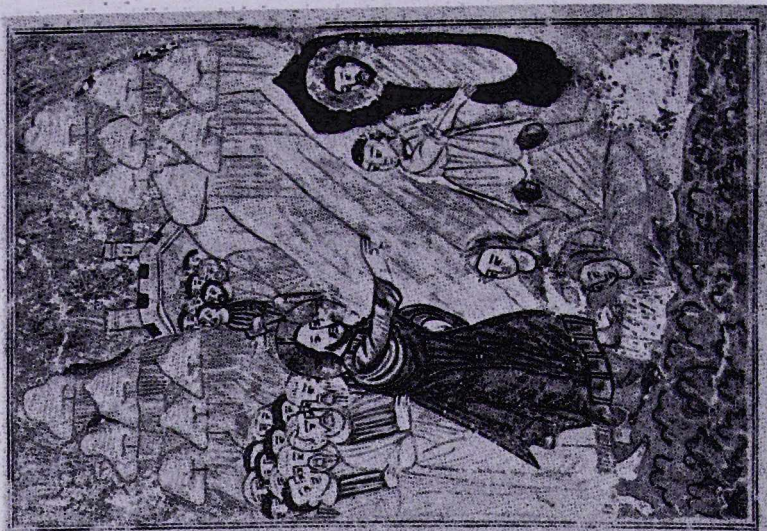
Թարսիզի 1311 թ.ի մանրանկար