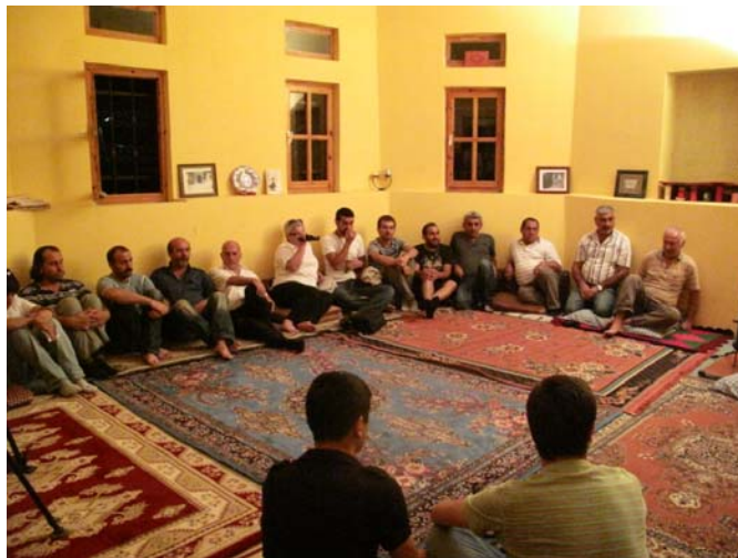
Ալեիներն ու ալեիացած հայերը Կուրէշ Բաբայի Օջախում (լուս.՝ Շ. Խառատեան, 2011)

Մինչ գրուցում էինք, մատաղն արեցին, միսն եփեցին, բոլոր ուխտաւորները միասին վայելեցին, եւ երեկոյեան սկսուեց այն յիշարժան հաւաքոյթը, որտեղ բոլոր ալեիները սազի նուագի տակ հերթական անգամ կրօնական ինքնամոռաց յուզմունքով լսում էին հազրաթ Հուսէյինի սպանուելու պատմութիւնը: Իսլամի հետ որեւէ կապ չունեցող Կուրէշ Բաբայի պատուին կառուցուած տան ներքնասենեակներից մեծում հաւաքուող դեղէներն ու սէյիդները սազի նուագակցութեամբ յուզուած պատմութիւններ են երգում Ալի եւ Հուսէյին իմամների կեանքի, ինչպէս նաեւ իրենց՝ ալեիների պատմութեան դժուարագոյն դրուագների, «գալումների» (թուրքեր - շ.Խ.) նուաճումների, նրանց դէմ կռիւների մասին, դանդաղ պարեր պարում, ապա նաեւ՝ անցնում դիցազներգութիւնների, որոնցում դերեր ունեն Կուրաշը, նրա որդի Դիզգուն Բաբան եւ Շահայդարը, Հալուորու Սուրբ Կարապետը, սէյիդները, հայ քեշիշները են.: