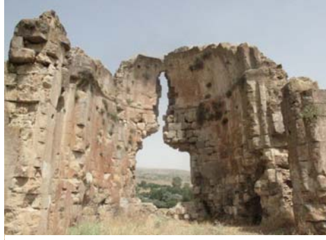
Խոզաթի Երկեն Գիւղի կիսասաքանդ եկեղեցին (լուս.՝ Հ. Խառատեանի, 2011)

- Ոչ մէկի, բոլորս էլ ալեւի ենք: Ամենաուշը ալեւի է դարձել մի մարդ՝ Բաքի Դելեթլին, այ նրա որդուն էլ այստեղ՝ Թունջելիում հայ են ասում: Որդին Էնէրն է, Էնէր Դելեթլի Բեդոյի (Պետոյի - Հ.Խ.) 44 : Նրան Թունջելիում յարգում են, նրա խօսքն այստեղ անցնում է: Առեւտրով է հետաքրքրում, հարուստ են: