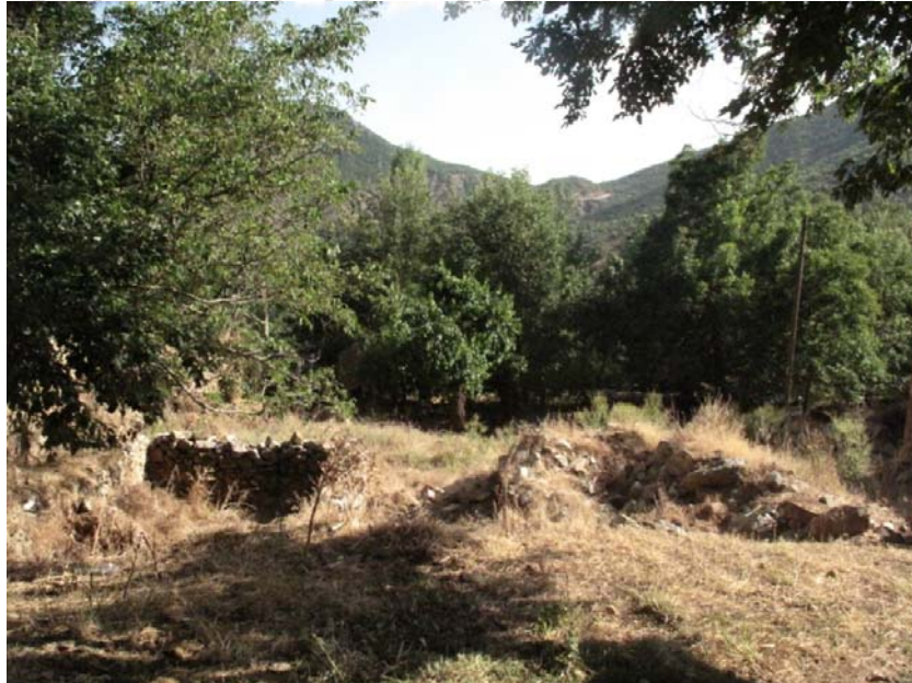
Հայրուոր Գիւղի աւերակները 1994ի բնակչության տեղահանումից յետոյ (լուս.՝ Հ. Խատատեան, 2011)

- Ոչ, նրանք էլ, իհարկե, ալեւիություն ընդունել են: Բայց նրանք շատ աւելի ուշ են ալեւի դարձել, նրանք երկար ժամանակ հայ են մնացել: