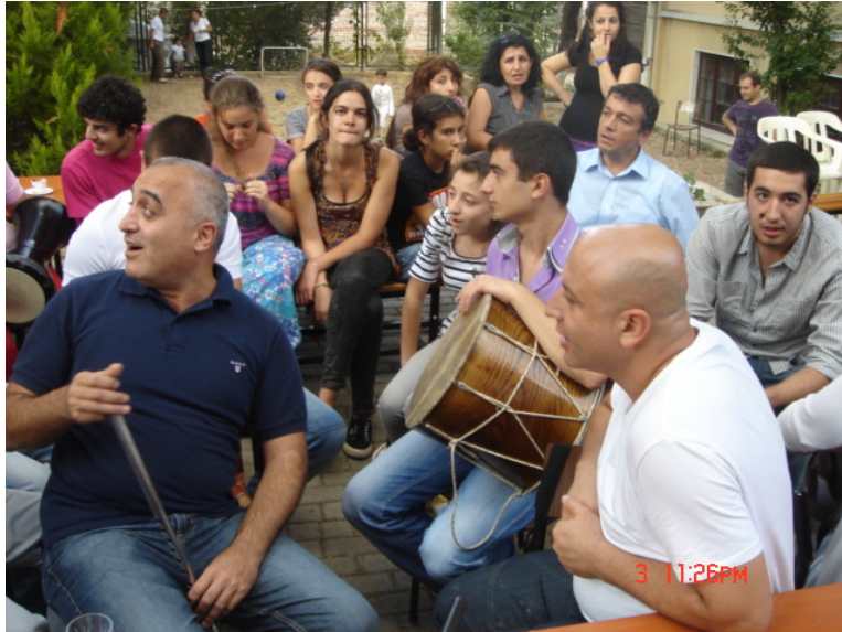
«Տայեթ-Նովա», «Թիրք Կարդաշլար» եւ «Վան» համոյթների երաժիշտները Ստամբուլի Երեք Մանկունք Եկեղեցու բակում, (լուս.՝ Հ. Խառատեանի, 2011)

Բաքըր գիւղում եւ եւ հօրեղբօրս զաւակները Պեզճեանը 65 կ'ուսանէինք, մէկ տարի բողոքականացուած ժառանգ գացած ենք, անիկ քիչ մը թանկ էր, Պեզճեանը աւելի էժան էր: Բողոքական վարժարանում Հրանտ Դինքին 66 ծանօթացայ, Հրանտէն մէկ տարի, մէկ դասարան մեծ էի եւ: Մերիններուն մասնաւոր նախընտրանքը մասնաւոր վարժարան էր դարձել, թուրքական վարժարան երբեք չի գացինք հէջ մէկերնիս, ամէնքս հայկական վարժարան, եւ որչափ որ կրցանք, անչափ ուսանեցանք: Ամէն մարդ որչափ ուզէր, անչափ պիտի ուսանէր, փոխանակ որ մերինները աշխատող մարդու միտք ունէին, փողի միտք ունէին, եւ օր մը չնախատեցան, որ մենք չենք աշխատիլկոր, կ'ուսանէնքկոր: Ուսանեցանք, եւ բողոքական վարժարան, վերջը Տատեան 67 , Տատեան՝ Բաքըր գիւղն է, Տատեանէն վերջը Կեդրոնականին 68 շրջանաւարտ եղայ, վերջը համալսարան քիմիայի ֆակուլտէտին շրջանաւարտ եղայ, աղբարիկս՝ Գարակեօզեանէն վերջը Կեդրոնականին շրջանաւարտ եղաւ, քոյրս Էսաեանին 69 շրջանաւարտ եղաւ, Ռաքելը Տատեանին շրջանաւարտ եղաւ: Մարկոսը՝ ամենափոքրերնիս, ատամնաբուժ համալսարանի շրջանաւարտ եղաւ, Տատեան-Սահակեան ատամնաբուժական համալսարանին շրջանաւարտ է, հօրեղբօրս բոլոր զաւակները որչափ որ կրցան ուսանել՝ ամէնը լիսէին շրջանաւարտ եղան: Վարդանը, միս հօրեղբօրս տղան, համալսարանի շրջանաւարտ