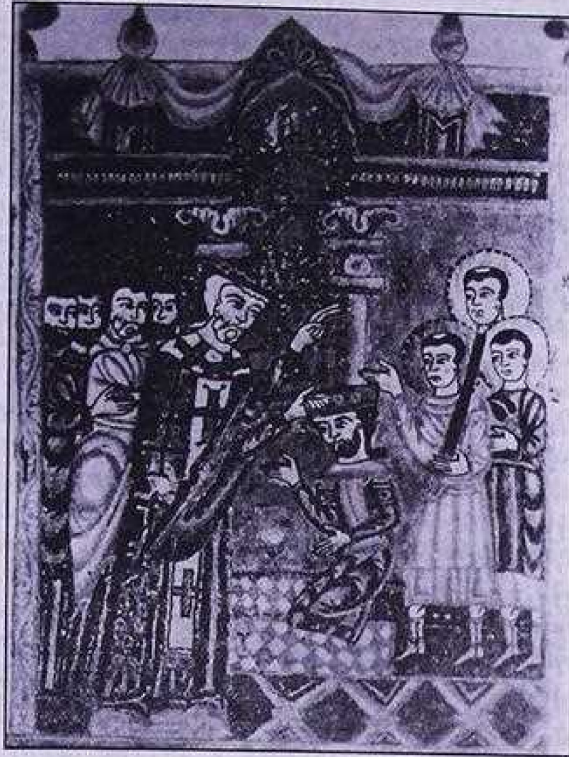
Թագաւորի օձման արարողութիւն (Մաշտոցի անուան Մատենադարան, ձեռագիր համար 5702, էջ 212բ):

Տեսական ու գաղափարական հող էր նախապատրաստուում նախ ընդհանրական կաթողիկոսական գահը գրաւելու եւ ապա էջմիածնի ու Աղթամարի կաթողիկոսական գոյգ աթոռները վերամիաւորելու ուղղութեամբ: Ահա թէ ինչու էր անհրաժեշտ Սմբատի խաղաքարտը: Աղթամարը միանգամից առանձնանում էր բոլորից: Նա միանգամից յայտնուում է ամենայն ուշադրութեան կենտրոնում, քանզի հայոց նորընծայ թագաւորի նստավայրն էր: