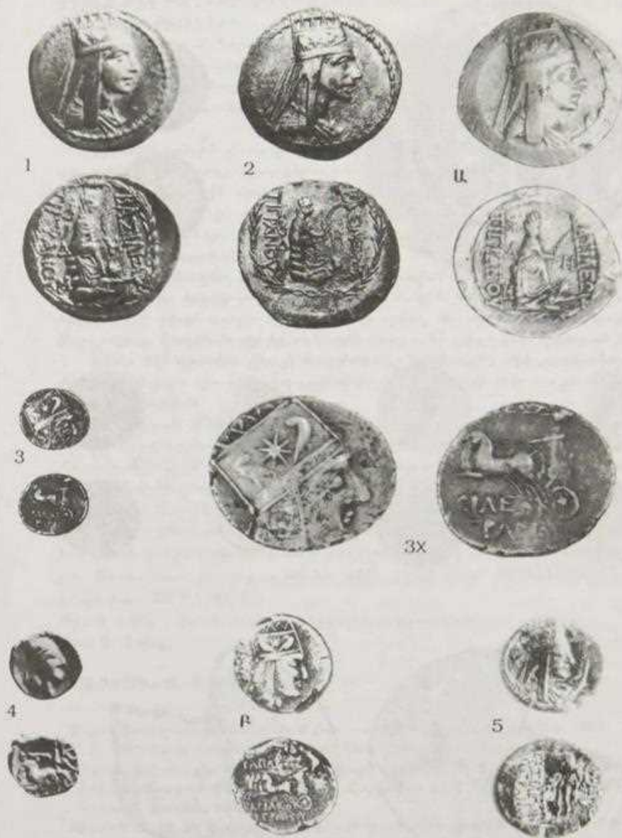
Տախտակ 1. Տիգրան Մեծի Բանի մբ անտիպ դրամները