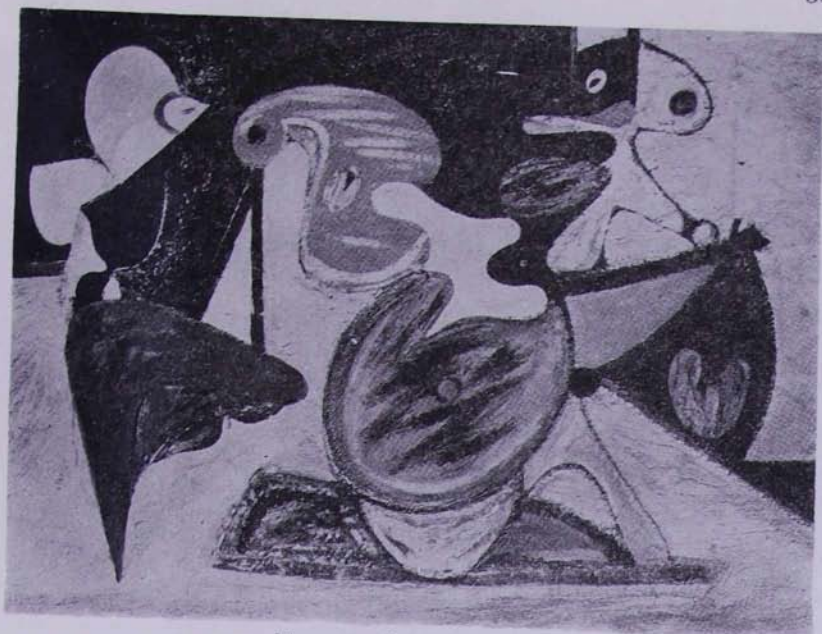
Կերպար խորգումի մէջ