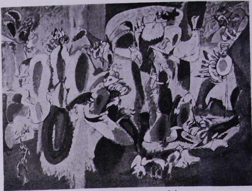
Լեարդը աֆլորին կատարն է