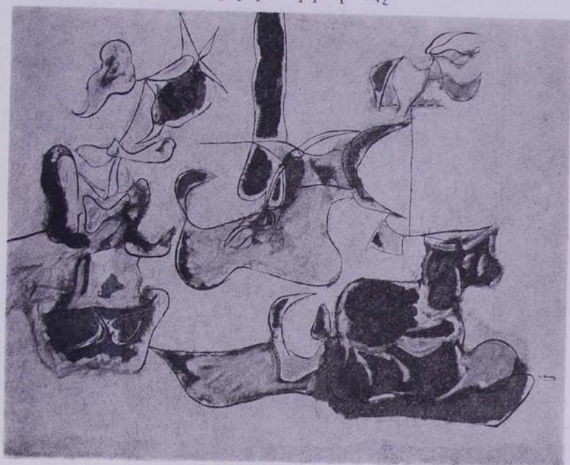
Պարտեզ Սոչիի մէջ