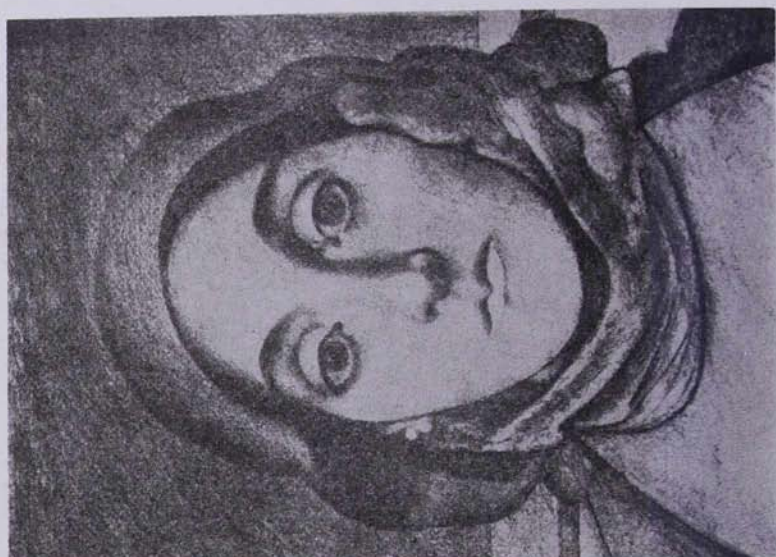
Մ. Օրբ դիմանկարը