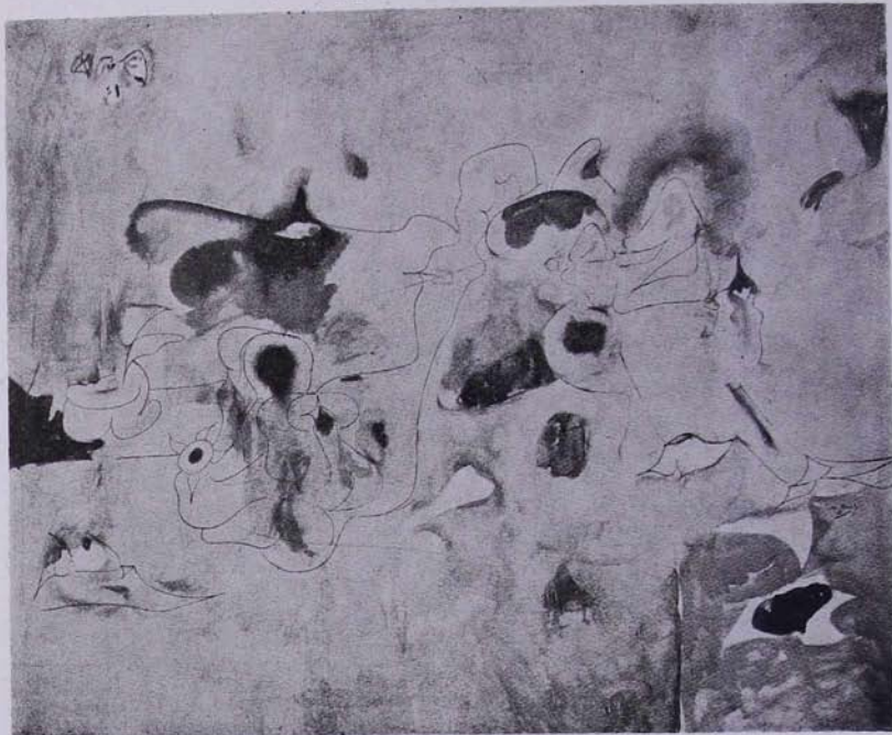
Արօրը և Նրգը