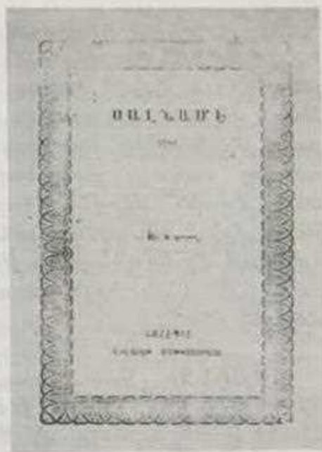
«ՍԱԼՆԱՄԷ», Հալիպ, 1868-69

«ՍԱԼՆԱՄԷ», [հիմնի] 1285 թուականի [24 Ապրիլ 1868 - 12 Ապրիլ 1869], Հալիպ, Հալիպ նահանգի Տպարան («Վիլայէթ Մաթպասի»), 14 x 19,6 սմ., 68 էջ: Կը բացուի «Մուգատտիմէ» («Յառաջաբան») վերնագրուած մուտքով մը, ստորագրուած՝ «Իրան թէրճիմանի» [Իրանի [հիւպատոսարանի] թարգման]՝ Նիկողոս Տէր Մարգարեանի կողմէ՝, որ անշուշտ եղած պիտի ըլլայ հայատառ այս հրատարակութեան պատասխանատուն: Հոն կը տեղեկացուի թէ, Հալիպ նահանգի «Մաքթուպճի» Հալիթ Պէյի կազմած Մալնամէին հերթական երկրորդ հատորին հայատառ հրատարակութիւնն է յիշեալը: