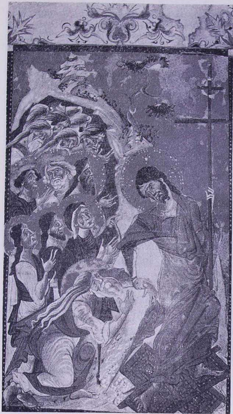
Թորոս Ռոսլին. Դժոխք Իջնեւը (Աւետարան, 1287 թ.):