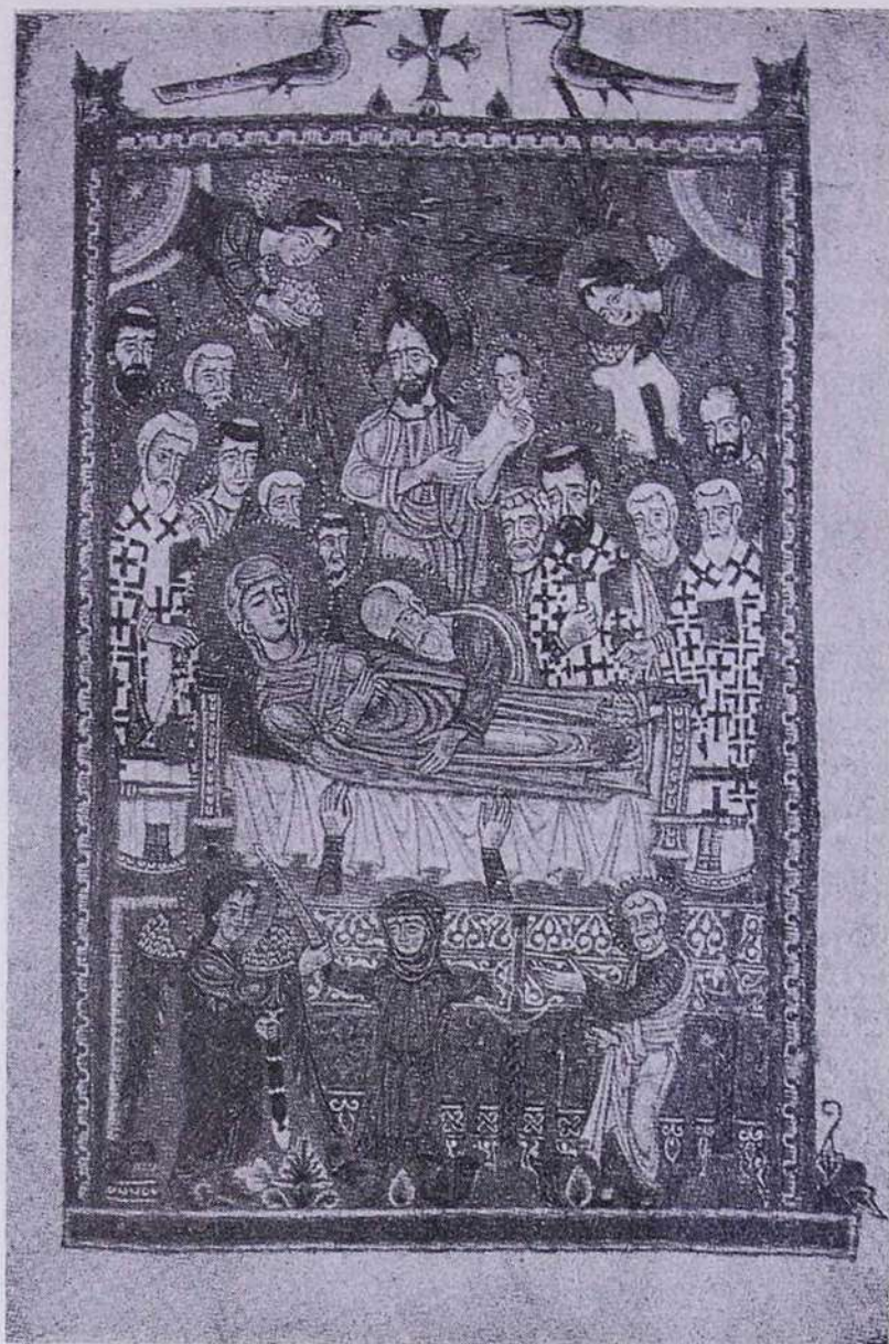
Սարգիս Պիծակ. Աստուածների Վերափոխումը («Արփունական Աւետարան», 1336 թ.) :