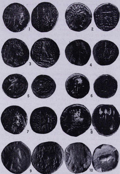
Թիւ 1-10 դրամները կը պատկանին Տիգրան Բ. ի :