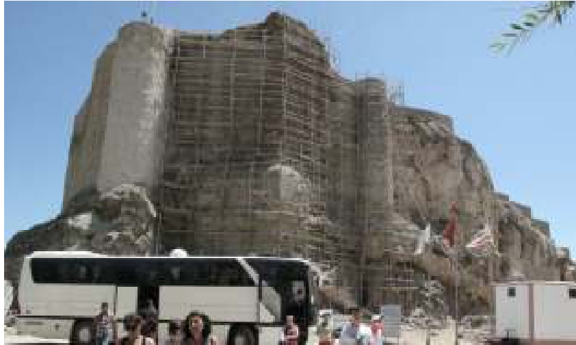
Խարբերդի բերդը նորոգում է, 2010