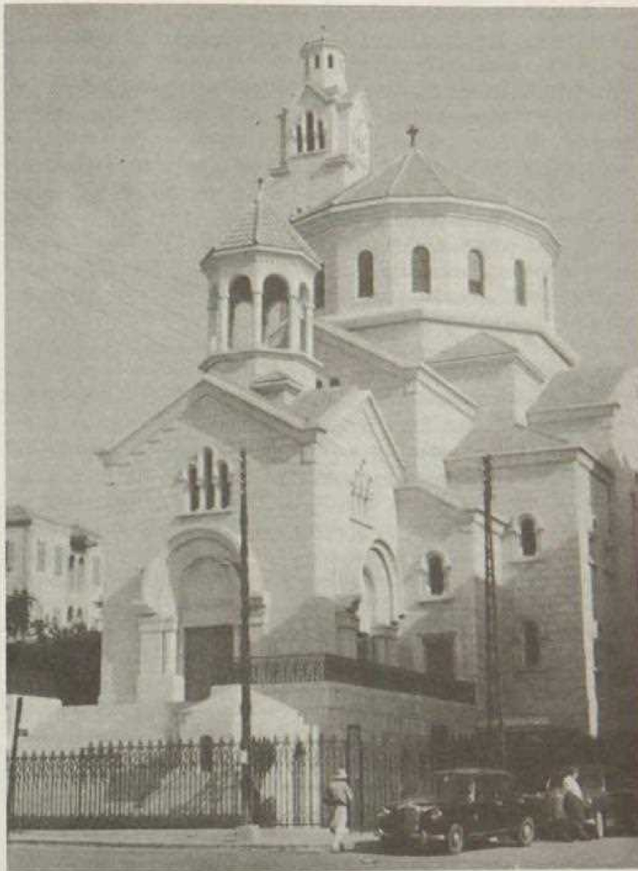
Տրպասս հրապարակի Ս. Եղիա - Ս. Գրիգոր եկեղեցին:

«1958. Սուրբ Եղիա - Սուրբ Գրիգոր Մայր Տաճարը (11) , [Պէյ- րուժ], Լիբանան