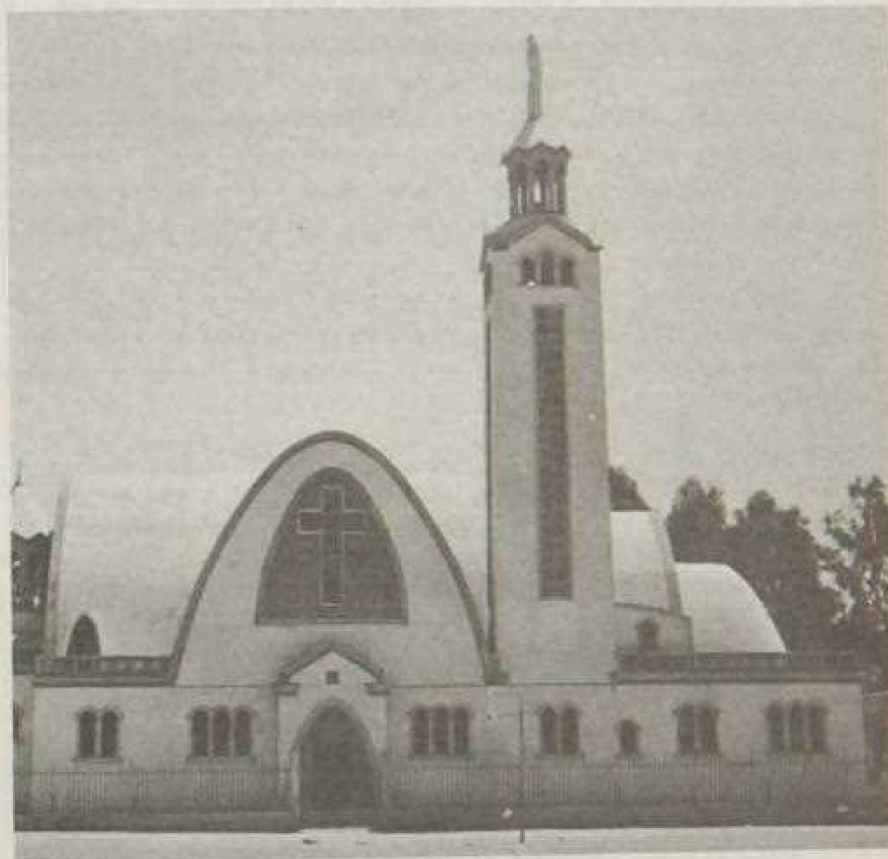
Սուրբ Փրկիչ, Գուրգ Համուտ, 1856:

խառանքներուն եւ կառուցէր «խալաճական աղօթքին ամենէն յարմար սրահը» (37) : Շէնքը կառուցուած է երկնքիփուն թարերով եւ փորթիքները ունին ողնափայտի ձեւ: Մինան անոր վրան աչխատեցաւ քանդակագործի մը հանգոյն եւ տուաւ անոր սքանչելիքը արտաքին կերպարանքին եւ զմրէթը զեռեղեց ութը սիւներու վրայ: Մզկիթին