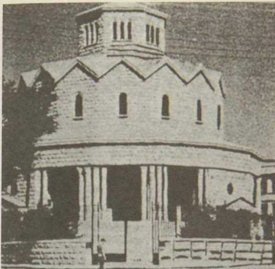
Հալւափ Հայ Կաթողիկէ «Ջուարթնոց» եկեղեցին, 1958:

յէն, Կիլիկիայէն, Իգմիրէն եւ այլ վայրերէ արտաքսուած Հայ զանգուածներու տառապանքին եւ հոգեկան կացութեան: Իր արմատներէն պոկուած՝ Հայը դարձաւ սփիւռքահայ եւ դատապարտուած՝ կեանքն սկսելու զերոյէն: Հիւղաւան, ապա համեստ տուներ, եւ կէս դար ետք՝ նախանձելի վերելք՝ տնտեսական ու հաւաքական կեանքի մէջ: Հիւրընկալ երկիրներու մէջ կազմակերպուեցան համայնքները, եւ իրարու հետ հակամարտութեան մէջ անգամ՝ կուսակցութիւնները վառ պահեցին Հայուն հայրենասիրական ոգին: Եկեղեցին առաջնակարգ դեր վերցուց համախմբման գործին մէջ, ամօքեց ժողովուրդին ցաւերը եւ սատարեց անոր վերելքին: Եկեղեցիներու կառուցումը յաճախ հանդիպեցաւ անհամաձայնութեան եկեղեցական եւ աշխարհական մարմիններու միջեւ, բան մը որ կաշկանդեց ազատ թոյլքը ճարտարապետին: Ահա թէ ինչո՞ւ Սուրբոյ եւ Լիբանանի մէջ ճարտարա-