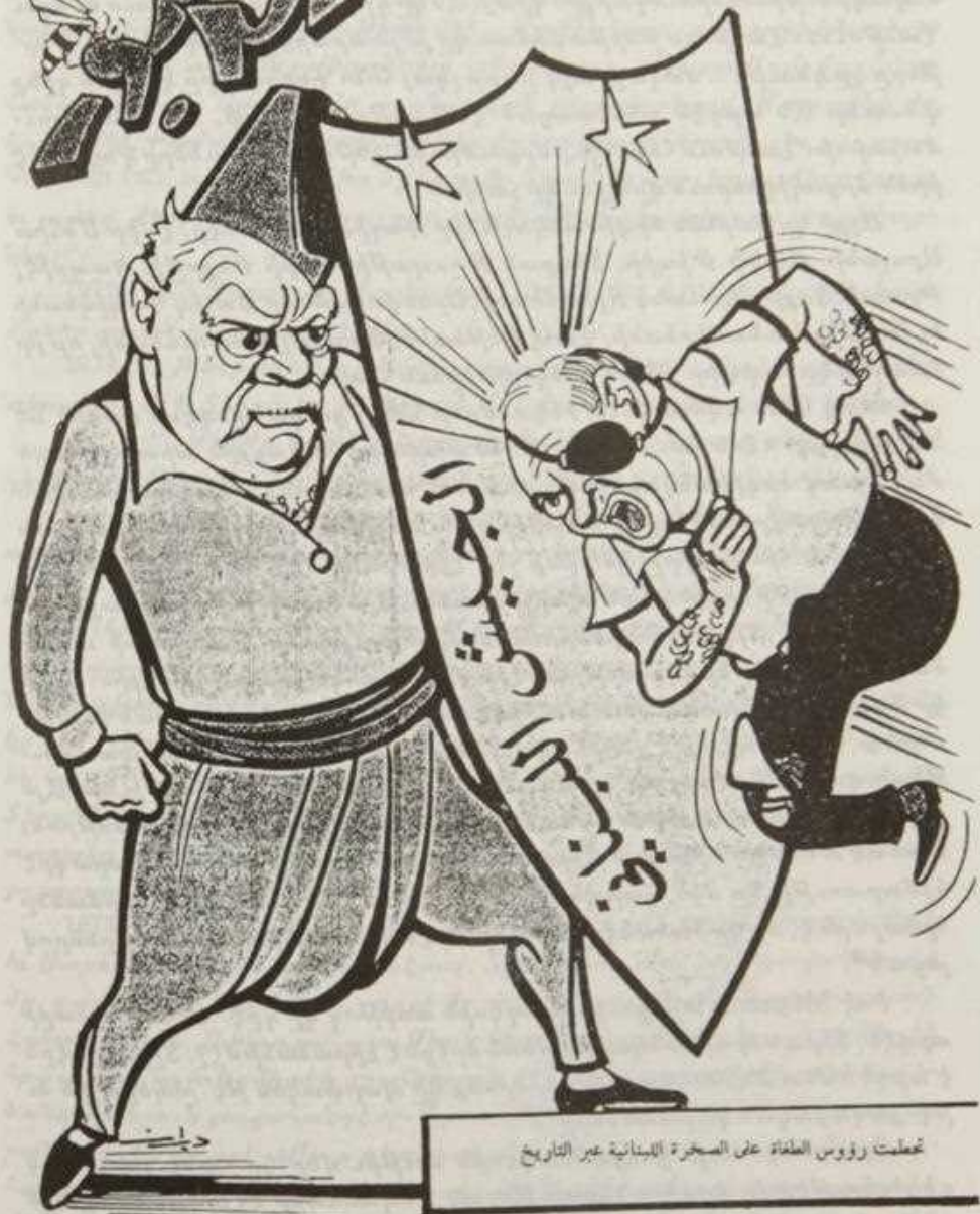
تعلقت رؤوس الطغاة على السجرة اللبنانية عبر التاريخ