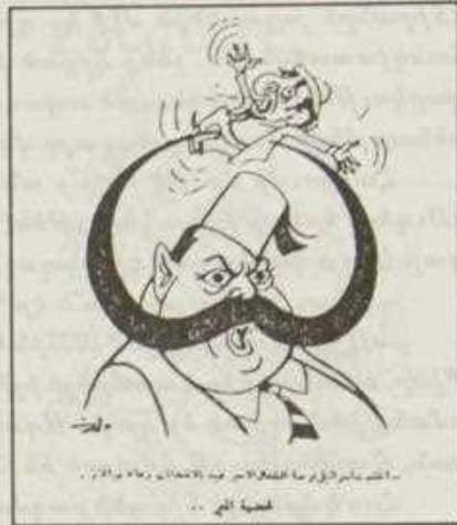
Էմիր Մեծիտ Արսլանի գայրոյթը

Արծիւը իր վերջին բարձունքին հասած էր...: Ն. Խոշաֆեան, իր