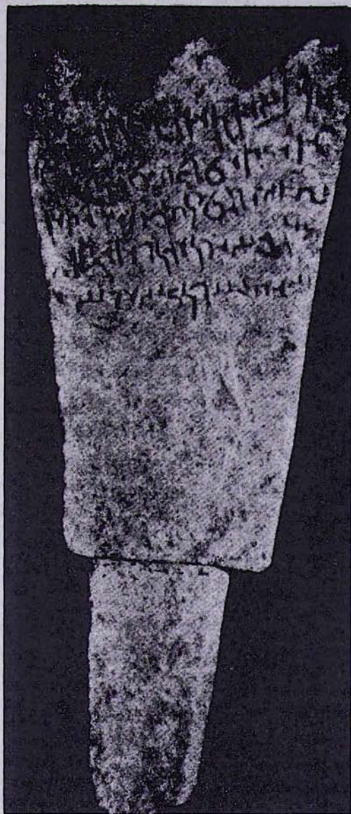
ԹԵՂՈՒՏԻ ԱՄԲՈՂՋԱԿԱՆ ԿՈԹՈՂԸ