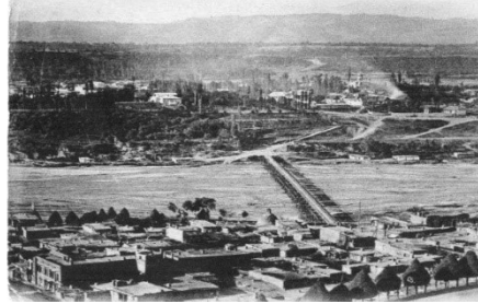
Ղուբա, ԺԹ. դար. գետի աջափնեակում փռում էն հայկական եւ ռուսական, իսկ ձախափնեակում՝ հրէական Սլրբողա թաղամասերը