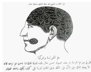
علم الفراسة ونزكيا علم الفراسة ان هذه الصورة احسن مثال لهذه الدولة العثمانية اما جسمها فهو ارسته لانه لا يوجد انتفى حتى الآن على شكله وبقى الثقت اوريا على كيف يكون رصمته العثمان