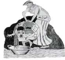
الدولة - قد تمت في تطهير الارض من الادران الأثمة واحدة استعنت بجلي العالم - لا تشعري ايتها للدولة فهدم الدولة العثمانية

Եւրոպական տէրութիւններին, որոնց քաղաքականութիւնն առանցքային նշականութիւն ուներ աշխարհում խաղաղութեան եւ անվտանգութեան պահպանման տեսանկիւնից, այդ կործանուող «հիւանդ մարդու» գոյութիւնն անհրաժեշտ էր՝ քաղաքական հաւասարակշռութիւնը