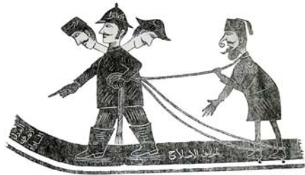
Մի 18-րդ դարի արաբական պատկեր, որտեղ արաբական իշխանութիւնները ցուցաբերում են իրենց անկեղծութիւնը և իրենց անկարողութիւնը հայ ժողովրդի շահերը պաշտպանելու համար:

Այդ շրջանում Բրիտանիան Ռուսաստանին սիրաշահելով էր զբաղուած, երբ խոստանում էր Թուրքիայի հաշուին մեծ զիջումների (այդ թւում՝ Հայաստանը նուիրաբերել) գնալ: Իսկ Ռուսաստանն իր հերթին հետեւում էր, թէ